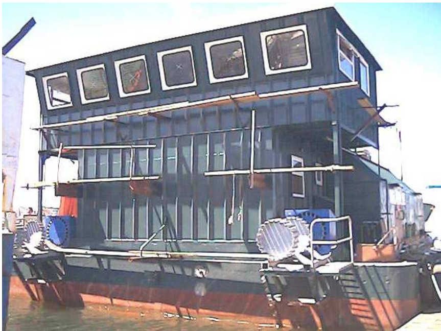
Figura 2 : Bodega